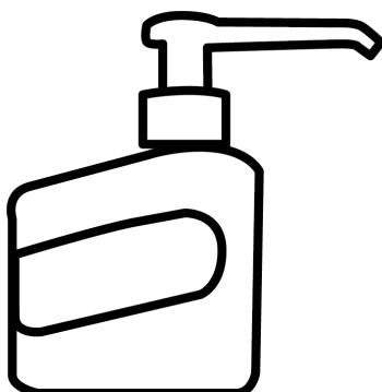
500ml pumbaga pudel